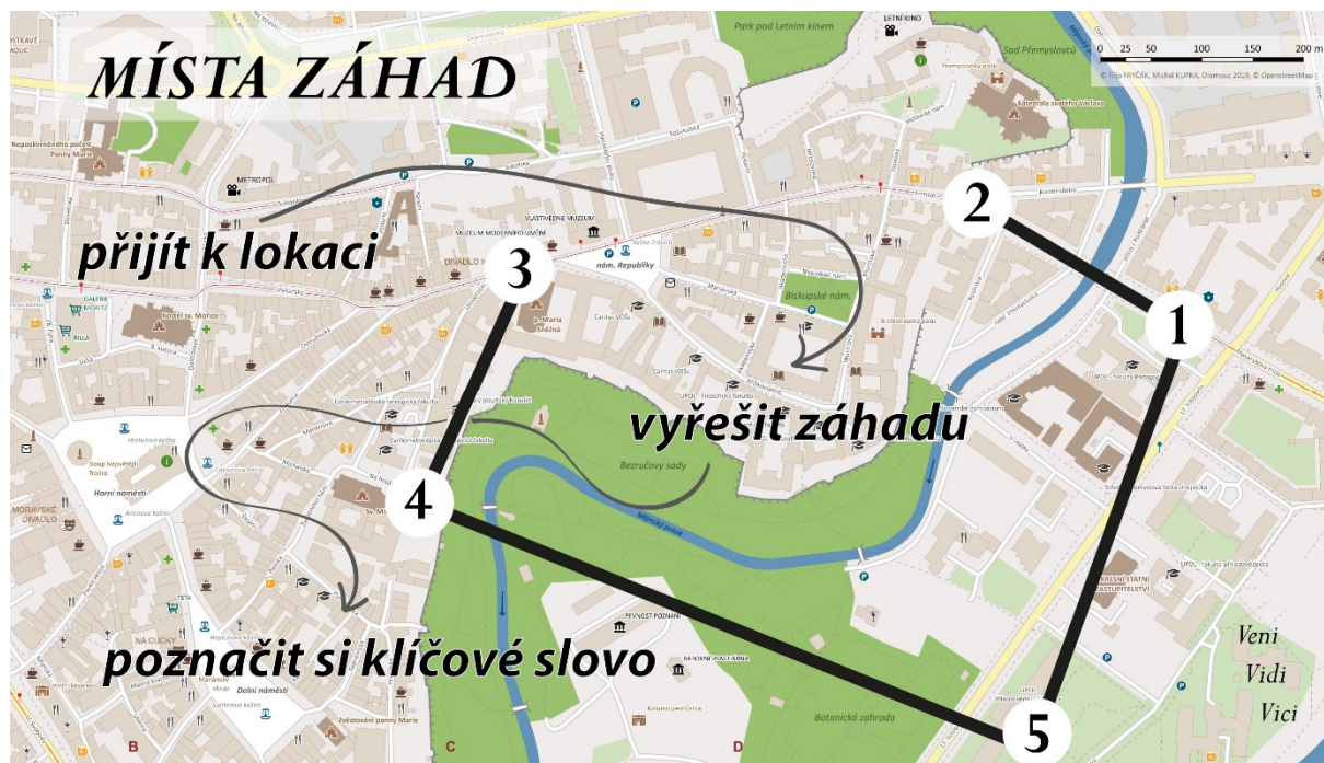
Obr. 2 Mapa s místy hádanek