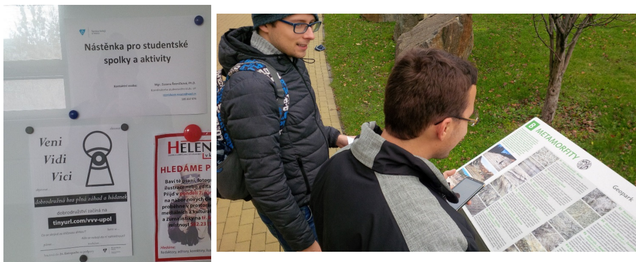
Obr. 3 a 4 Plakát se hrou v menze a účastníci řeší první záhadu

Ve druhé části řešení projektu proběhla distribuce plakátů a letáčků se hrou a její uveřejnění na sociálních sítích. Hra trvala nepřetržitě od 7. do 24. listopadu, mohl se jí účastnit kdokoliv a kdykoliv během tohoto období. Její kompletní instrukce byly k dispozici na adrese: https://tinyurl.com/vvv-upol