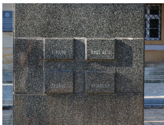
Obr. 1 Ukázka hádanky č. 2